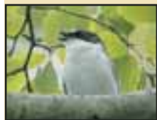
Un solitaire appelé à le rester